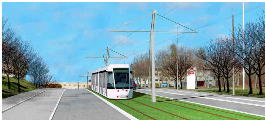
Illustration: Aarhus Letbane