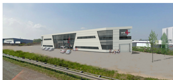
Wecare4u's domicil, set fra motorvejen ved Ringsted